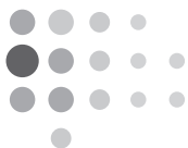
Tableau 1: Les syndicats en Russie